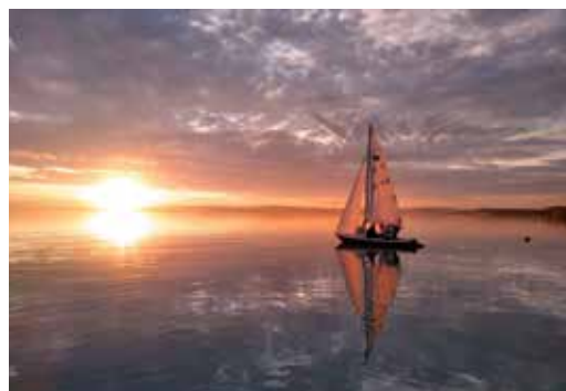
Csend - Göncz Berci